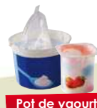
Pot de yaourt, crème fraîche