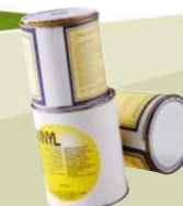
Boîte en métal