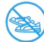
J'évite les efforts physiques