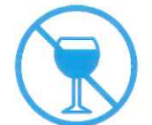
Je ne bois pas d'alcool