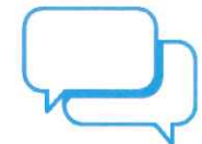
Je donne et je prends des nouvelles de mes proches