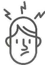
Maux de tête