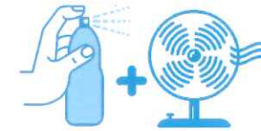
Je mouille mon corps et je me ventile