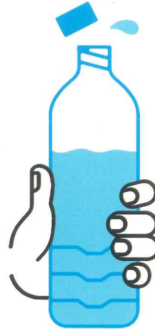
JE BOIS RÉGULIÈREMENT DE L'EAU

En période de canicule, quels sont les bons gestes?