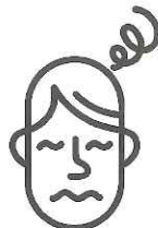
Vertiges / Nausées