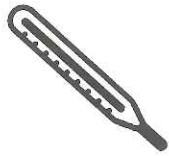
Fièvre > 38°C